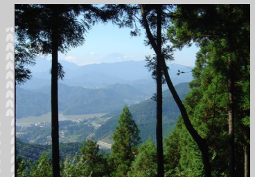
● 小仏城山(相模原市相模湖町)