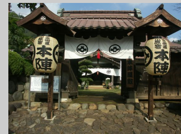
★ 小原宿本陣 (相模原市相模湖町)